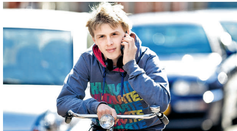
Telefoneren op de fiets kan grote ongelukken veroorzaken.

Ik lees altijd met plezier de rubriek van Beatrijs Ritsema. Maar zaterdag sloeg ze de plank mis. De vraag ging over een moeder van drie kinderen, die de jongste, gehandicapte zoon, een groter deel van de erfenis wilde geven. De oudste is het daar niet mee eens en zet zichzelf te kijk door te stellen dat de moeder alle kinderen hetzelfde bedrag moet geven. Je zou verwachten dat Beatrijs de vloer aanveegt met dit egoïstische standpunt. Maar nee, de oudste heeft volgens haar gelijk en moet bij de moeder 'aandringen op