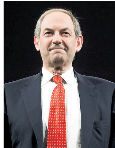
Job Cohen, afgelopen zondag.